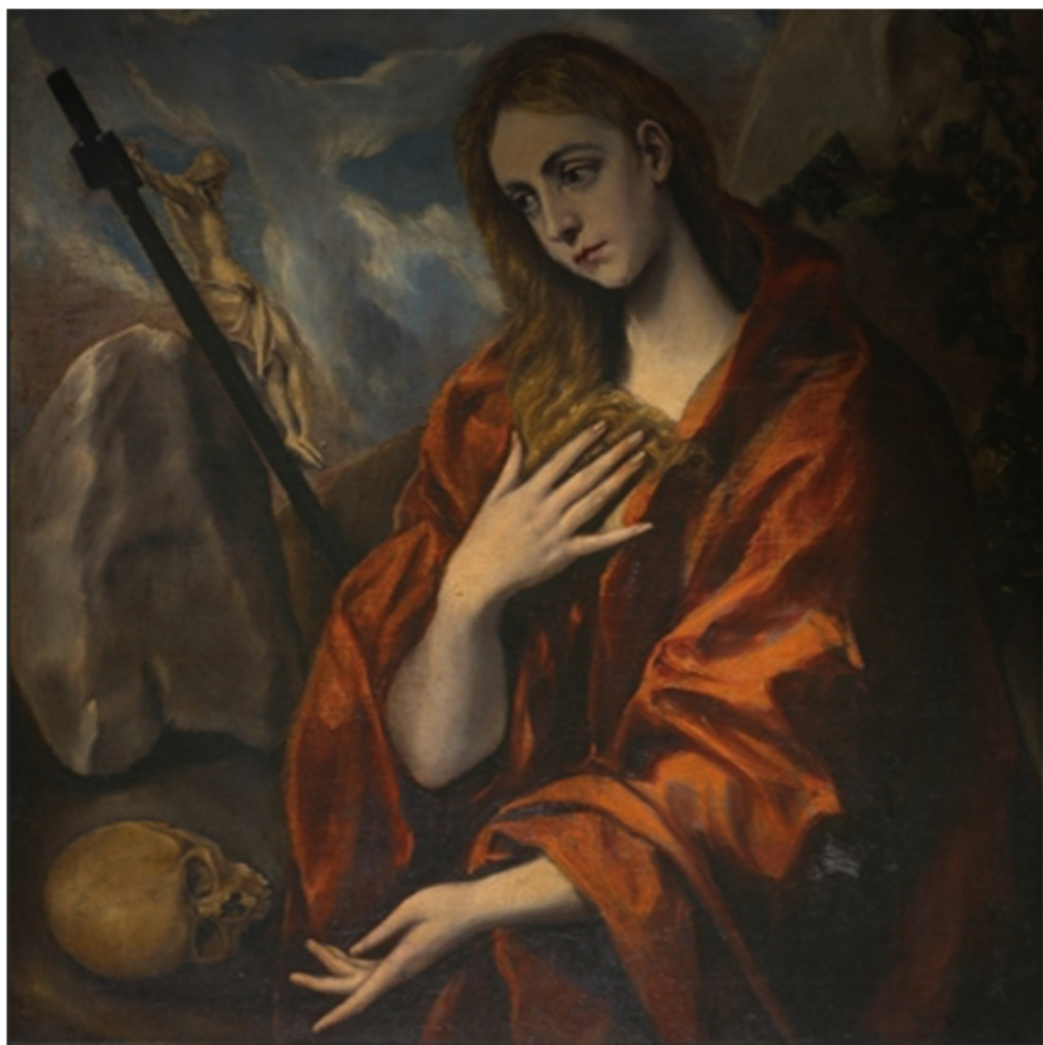
Magdalena penitente con la cruz